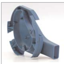
Image de l'équipe Renault F1.

Le matériau nanocomposite Bluestone est idéal pour les tests en soufflerie, où la rigidité des composants est primordiale.