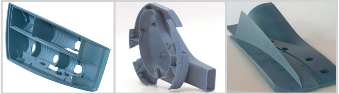
Pièces aérodynamiques et fonctionnelles produites en plastique nanocomposite Bluestone. Images (au centre et à droite) avec l'aimable autorisation de l'équipe Renault F1.

Un nanocomposite technique très rigide, ouvrant de nouvelles possibilités aux utilisateurs de stéréolithographie.