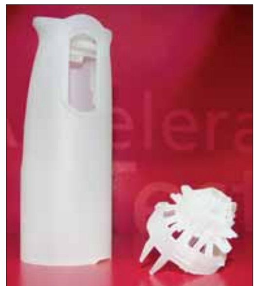
Prototype de brosse à dents électrique réalisé en matériau Accura si 45HC.