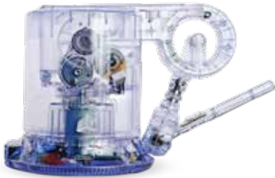
Touch 触觉式力反馈设备的功能测试和装配检查, 具有极佳的透明度

采用超高速打印技术实现大规模生产运行和超凡效率。可快速互换的打印材料输送装置保持机器正常运行, 以将您的部件推进到制造工作流程, 而 3D Connect 服务则提供主动式和预防性的支持。