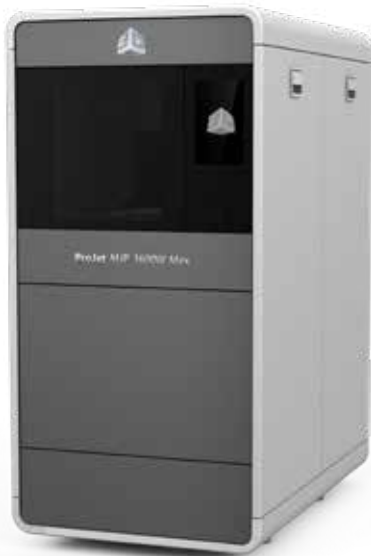
Imprimante 3D de modèles en cire de précision à haut débit, et capacité élevée Projet MJP 3600W Series