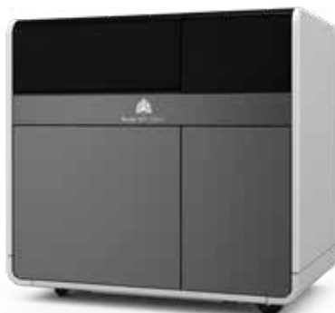
Imprimante 3D rapide et abordable de modèles de précision en cire Projet MJP 2500W

Une zone d'impression jusqu'à 4,7 fois plus importante que celle des imprimantes de la même classe permet de couvrir un éventail plus large d'applications et un fonctionnement sans surveillance plus long. La productivité élevée des imprimantes à cire Projet MJP permet un amortissement rapide et un retour sur investissement important.