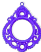
Visijet M3 CAST