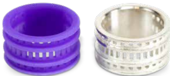
Bague imprimée en Visijet M2 CAST et coulée en argent

Garantie/Avis de non-responsabilité : les caractéristiques et performances de ces produits peuvent varier selon l'application, les conditions de fonctionnement, le matériau utilisé et l'utilisation finale. 3D Systems réfute expressément toute garantie, explicite ou implicite, y compris, mais sans limitation, les garanties de qualité marchande et d'adéquation à une utilisation particulière.