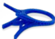
Visijet M3 Hi-Cast

Imprimez des arêtes vives, des détails extrêmement nets et des surfaces lisses avec une grande fidélité. Les imprimantes à cire Projet MJP sont idéales pour la fabrication de pièces de précision complexes en métal avec un polissage manuel réduit.