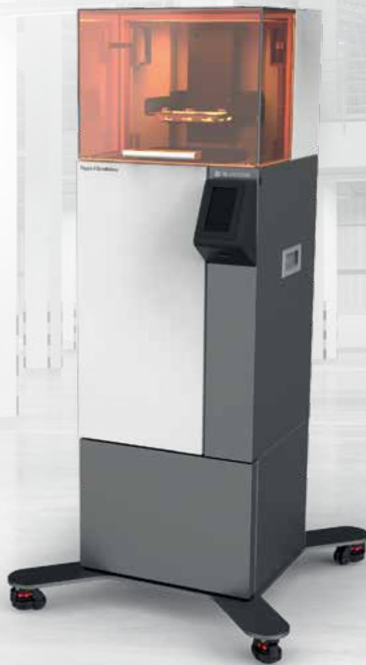
Figure 4 Standalone은 3D Systems의 확장 가능하고 완전 통합된 Figure 4 기술 플랫폼의 일부이며 소량 생산 및 빠른 설계 반복과 검증을 위한 당일 원형 제작에 적합한 경제적이고 다재다능한 솔루션입니다. 산업 등급의 내구성, 서비스 및 지원을 통해 속도, 품질 및 정확성을 제공합니다.